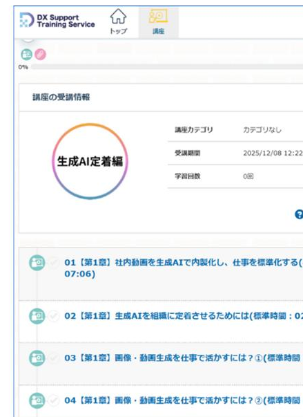
プラットフォームイメージ