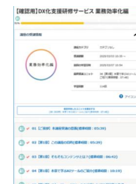
プラットフォームイメージ